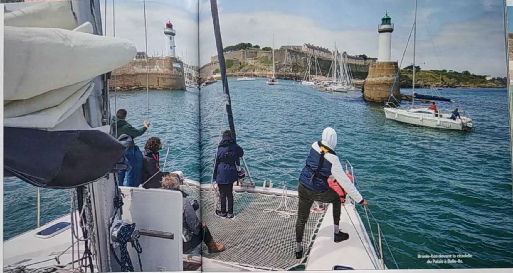
Branle-bas devant la citadelle du Palais à Belle-Île.

à voix haute la veille au soir par Matisse prennent tout leur relief. Un vent frais et une mer courte sous un ciel gris peu avenant s'offrent comme première expérience marine aux deux équipages. Perte de repères, instabilité du pont, complexité des manœuvres, plus d'un pourrait se demander ce qu'il est venu faire dans cette galère. À bord des deux Maldives 32, l'ambiance reste pourtant volontaire. Tout l'art d'enseigner de TEM s'est mis en action. Il n'est pas question de subir la navigation mais d'en être acteur. Des options ont été ciblées autour de la carte marine avec des possibilités de repli et surtout un beau challenge, raisonnable mais un peu sportif car au vent, atteindre Belle-Île. La décision se prendra collectivement et progressivement à la VHF entre tous les équipiers de Smiley et Arc-en-Ciel à hauteur de points de passage prédéfinis. Au fil des milles, chacun découvre le rôle qu'il peut jouer pour contribuer à faire avancer les catamarans. Hisser, virer, regarder la carte, barrer bien sûr, mais aussi préparer les sandwiches. Les premiers gestes seront à coup sûr gauches et lents, mais qu'importe le temps mis pour réaliser une manœuvre pourvu qu'elle soit