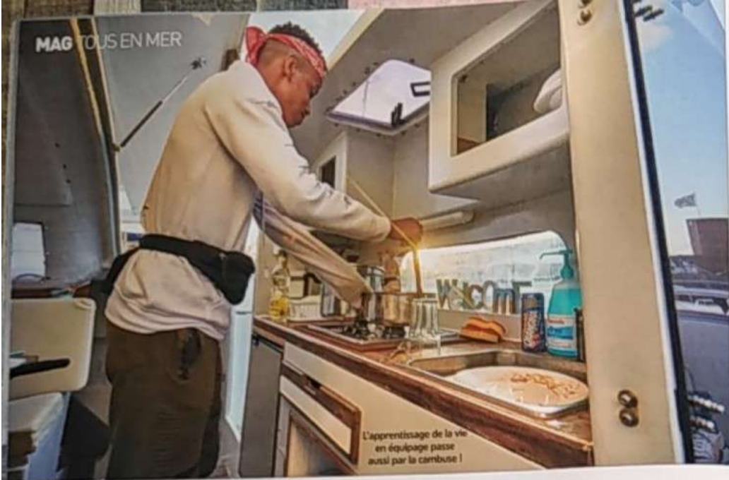
L'apprentissage de la vie en équipage passe aussi par la cuisine !