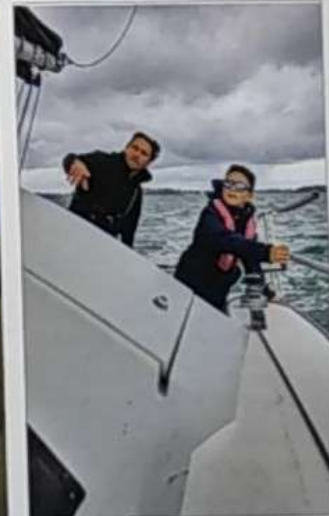
▲ Très vite, des équipiers volontaires se mettent à l'ouvrage pour la bonne marche des Maldives.