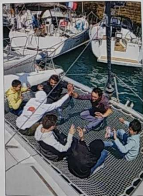
▲ Pari réussi pour cette petite croisière d'île en île en baie de Quiberon.