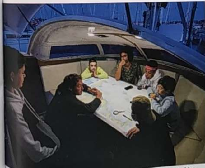
▲ Débriefing collectif autour de la table à cartes pour ceux qui le souhaitent. À bord, les tâches ménagères collectives sont obligatoires, l'apprentissage volontaire : et ça marche !