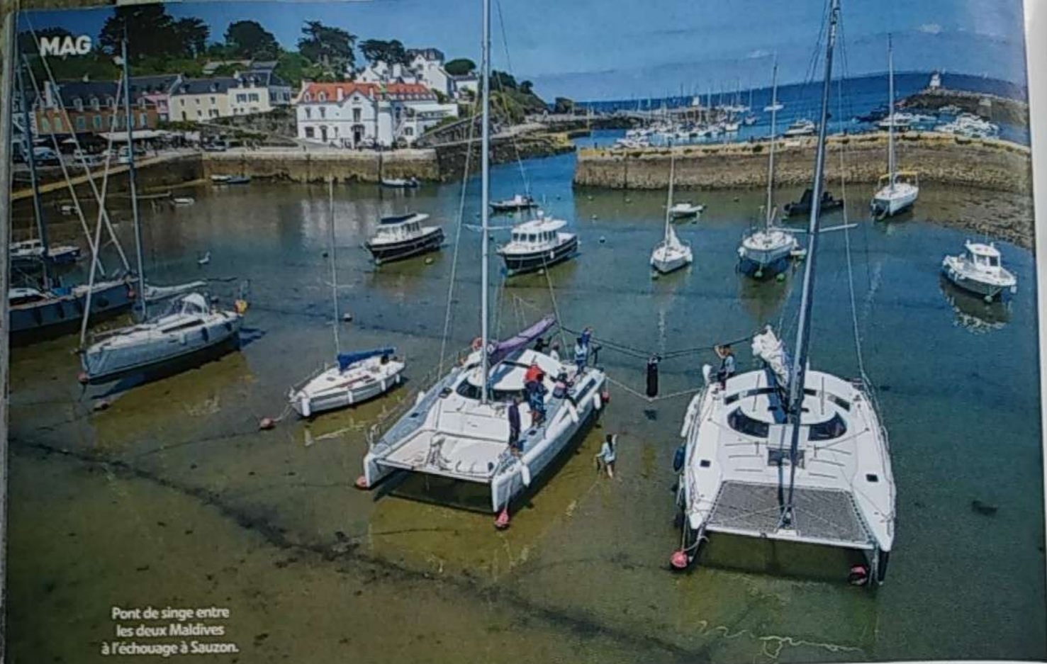
Pont de singe entre les deux Maldives à l'échouage à Sauzon.