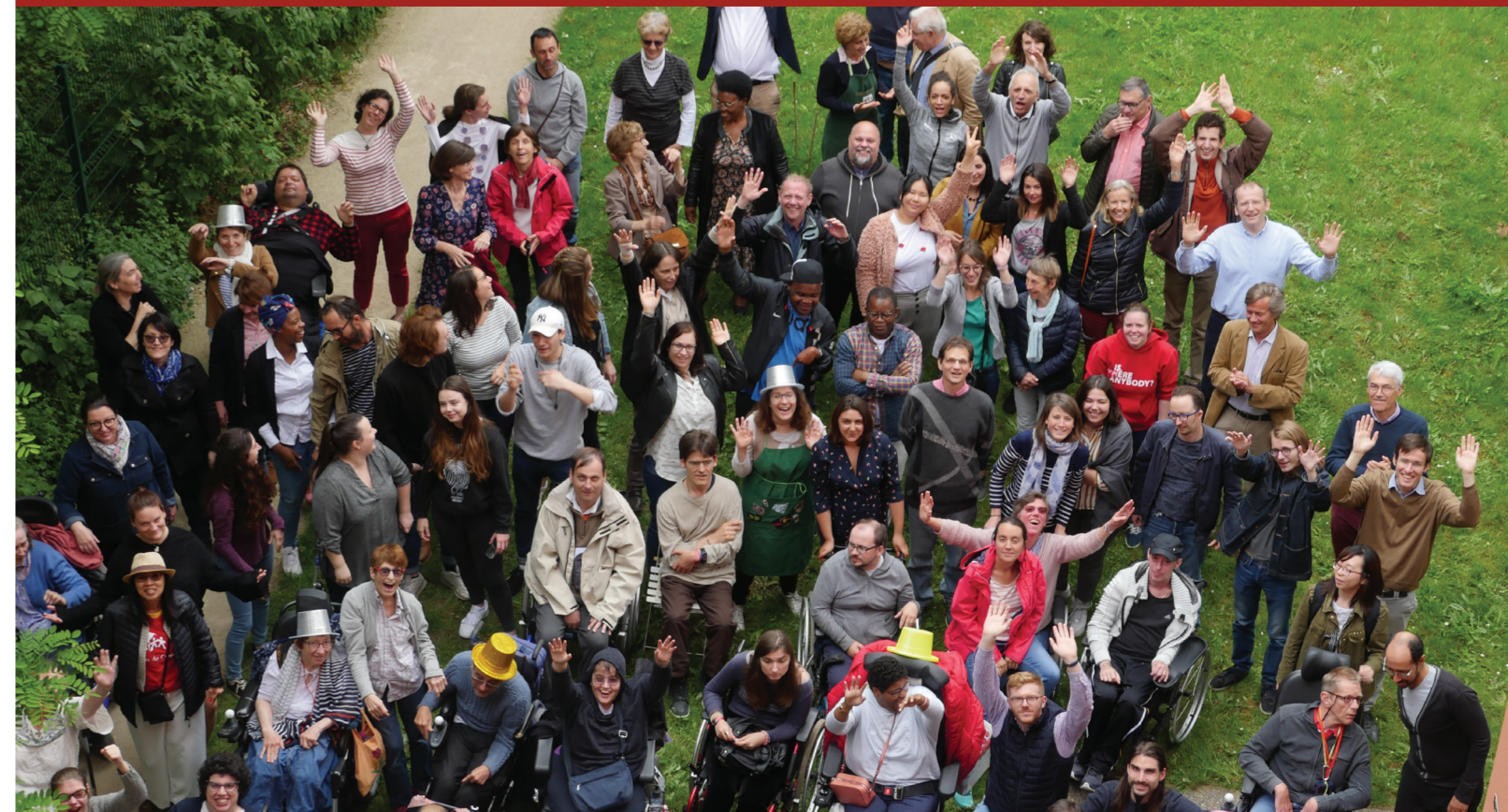
Fête régionale, Mai 2019