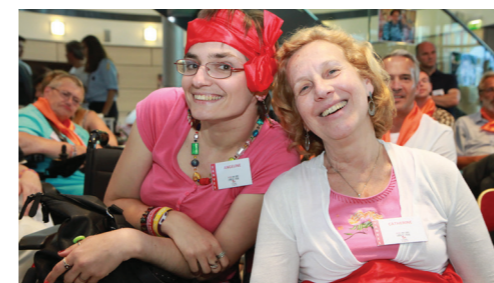
Célébreizh, Mai 2014 et Première fête fédérale, Juin 2015